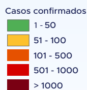
IMAGEM 1. Distribuição dos casos confirmados por Coronavírus segundo o município de residência.